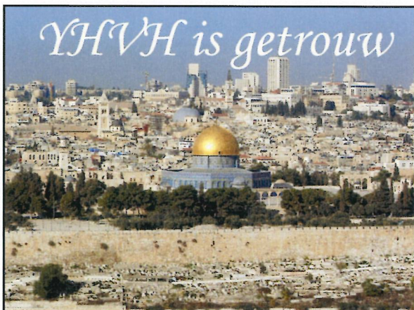
YHWH is getrouw